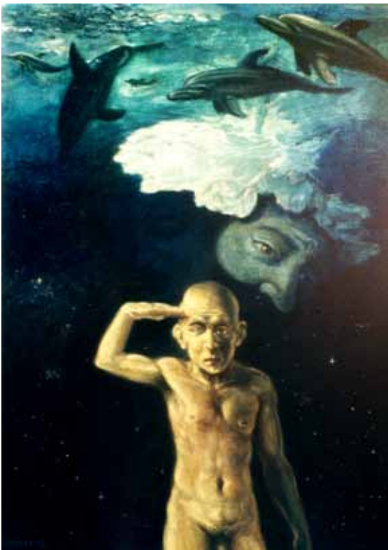
„Ahoi“ Tempera / Öl auf Malplatte 70 x 50 cm