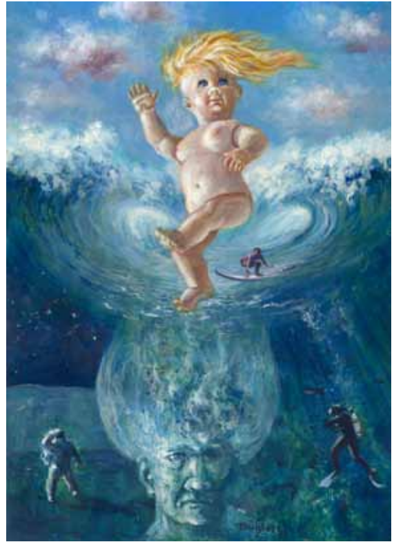
„Venusgeburt“ Acryl auf Malplatte 40 x 30 cm