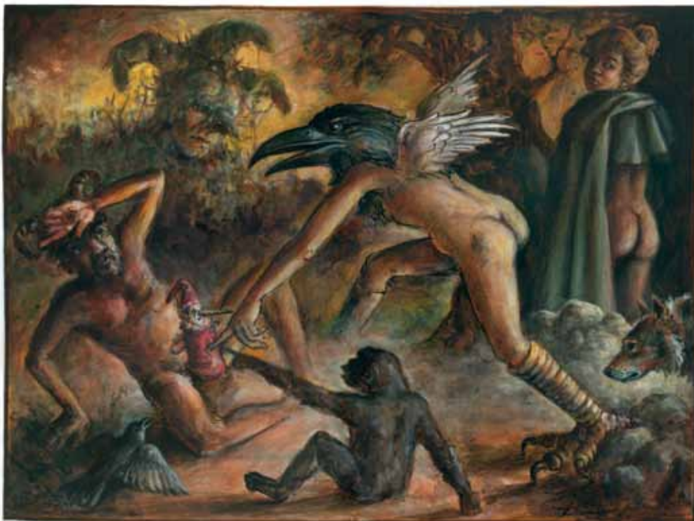
„Mitgespielt“ Tusche, Acryl 34,5 x 48,5 cm