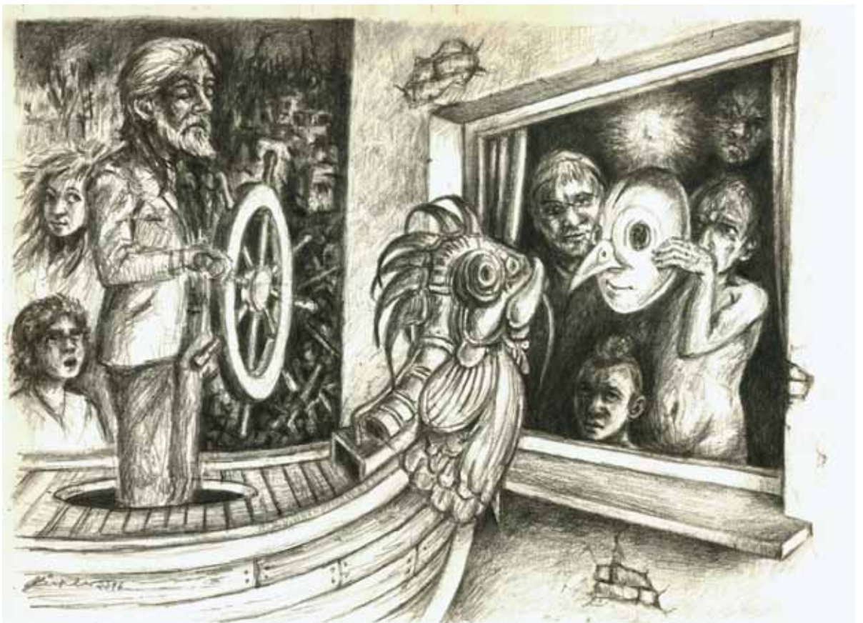
„Ankunft 2“ Bleistift 29 x 20 cm