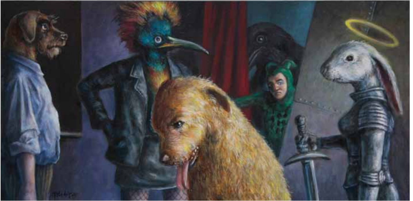
„Die Anderen“ Acryl auf Malplatte 28 x 57 cm