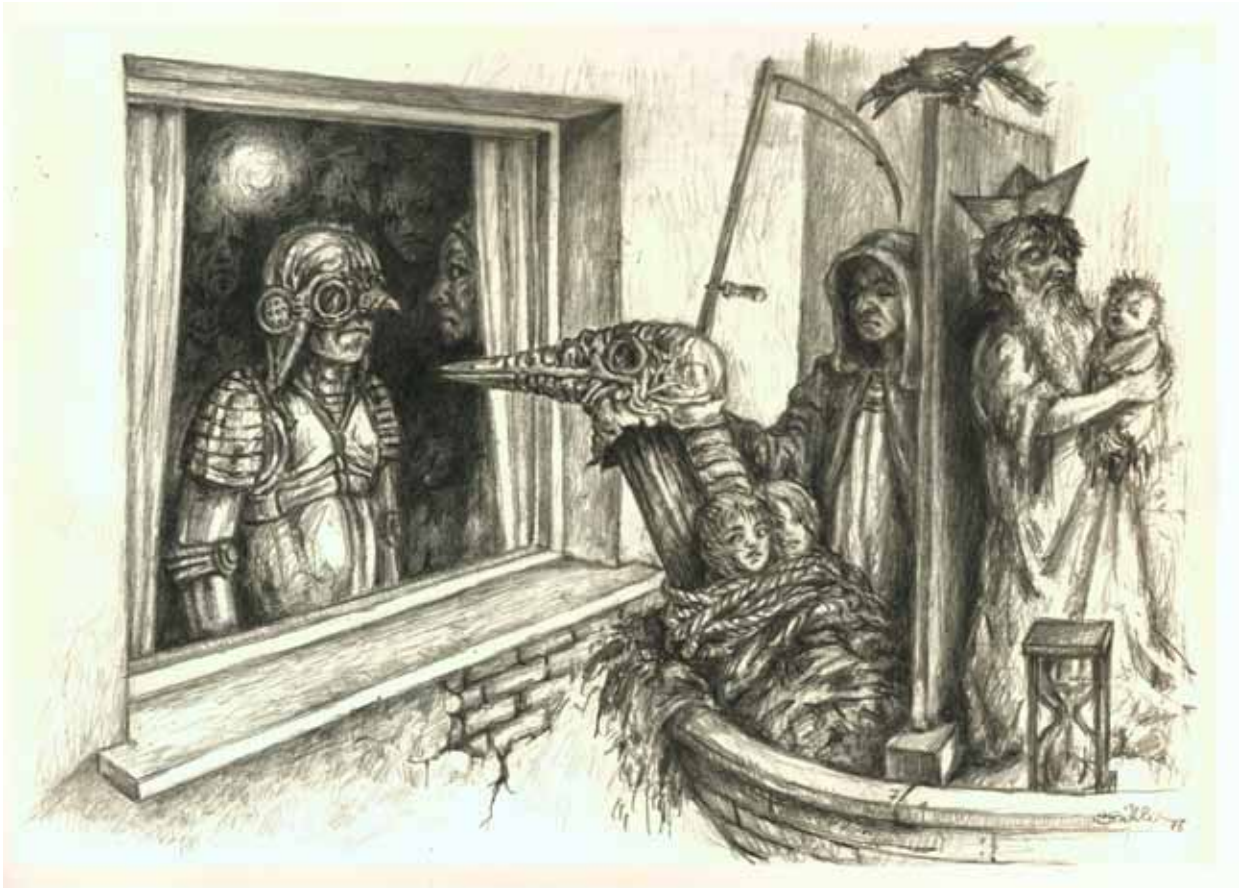
„Ankunft 1“ Bleistift 29 x 20 cm