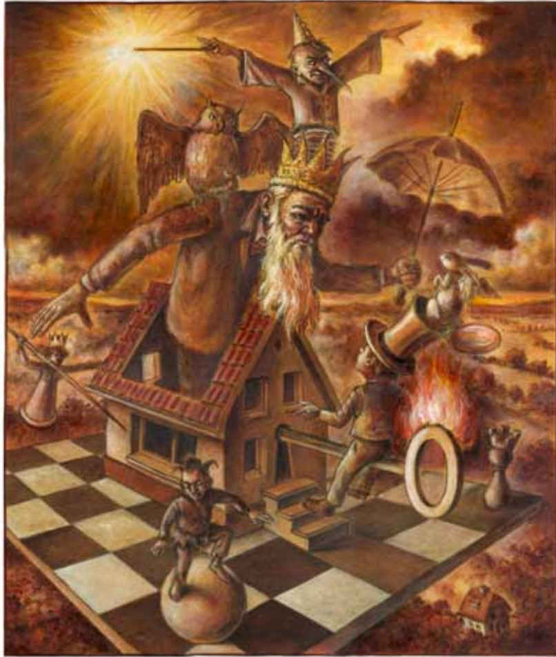
„Besucher“ Tusche, Acryl 60 x 50 cm