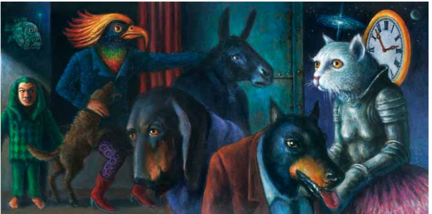
„Die Anderen“ Acryl auf Malplatte 29 x 59 cm