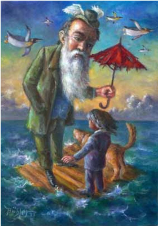
„Schutzbefohlen“ Acryl auf Malplatte 30 x 21 cm